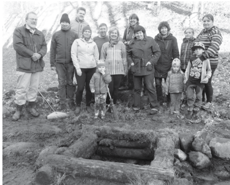
Üte õhtsapolikuge käis Elme alliku mant läbi paarkümmend suurembet ja tillembet talgulist nii Elmet ku kaugembelt kandist. Enämbjagu neist jäi pildi pääle kah.

No' jäi sõgla pääle 2331 rahha, kokko ligi 5 ja puul killo. Eurorahasi oll 346 tükki: 157 üte-, 89 kate-, 45 viie-, 37 kümne-, 16 katekümne- ja 2 viiekümnesendilist, a oll ka kolm üteuroolist ja üts kateurooline – kokko 18 eurot ja 50 senti. Tuu raha om lättehe saanu kuvve aastaga, nellä ja poole kuuga: euroraha tull Eestihe 2011. aastaga alguseh.