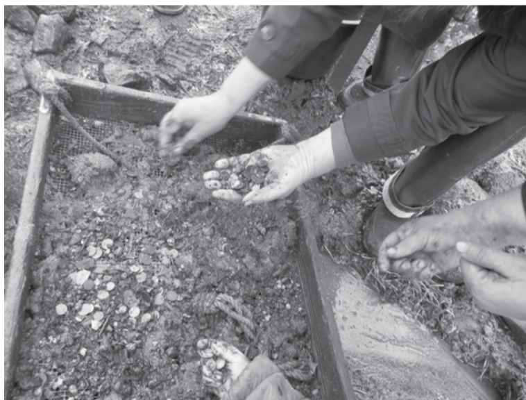
Kik sii pori kallati sõgla pääle, uheti viige üle ja korjati väärt kraam vällä.

Pallo inämb oll Eesti Vabariigi rahha: viiesendilisi oll 253, 10-sendilisi 824, 20-sendilisi 531, 50-sendilisi 191, a oll ka 108 1-kroonilist – kokko 404 kruuni ja 75 senti. Eurole ümbre rehkendädeh tege tuu 25 eurot ja 87 senti. Viiesenditsit oll selle nii veido, et päält 1997. aastaka naid inämb mano es tetä, a 2004. aastast jäivä nä käügist är – poodist inämb tagasi es anta. Nõukogude Liidu 1-kopkalisi oll 3, 2-kopkalisi 3, 5-kopkalisi 10, 20-kopkalisi 2 ja 50-kopkalisi 1: suuremb jago vinne rahha oll jo eelmine kõrd vällä korjatu.