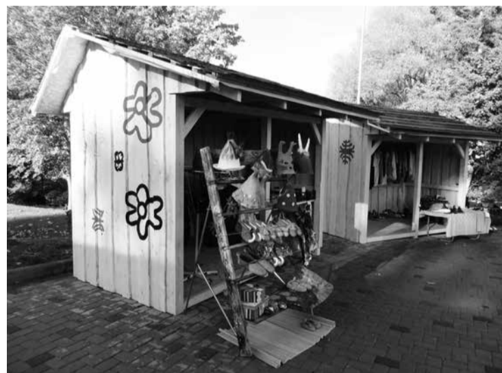
Prillagi ilus ja mulgimustreline Tõrva Mulgi turg saap Tõrva noore abige viil ilusambes.