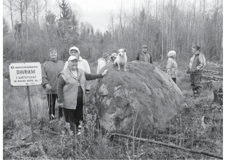
Kitzbergi Sõprade Selts om joba aastit Mulgimaa perimuskotussit uurnu. Sii keväde otseve na vällä Atika ohvrekivi.

Kige vanembe perimusluu kõneleve luudusest ja maast (oru ja mäe, viikogude, esieräligu kivi),