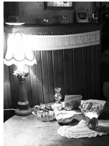
Mäe-Koda om siistpuult esieräligu vällänägemisege tore kodune kohake.