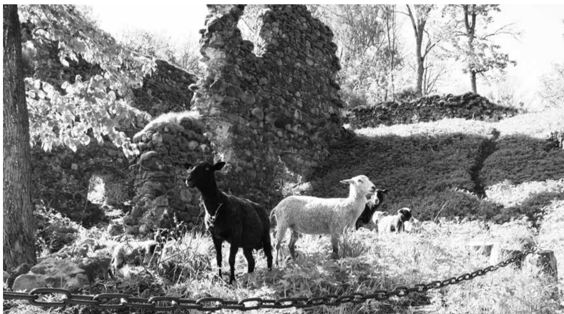
Tarvastu ordilinnusse varemide vahele passive lamba väige äste. Paist, et looma om esi kah rahul.

N õndasamate, ku Viljandi lossivaremide vahele tuudi lamba, tuudi villakandja lehekuu lõpuotsan Tarvastu linnamäele kah.